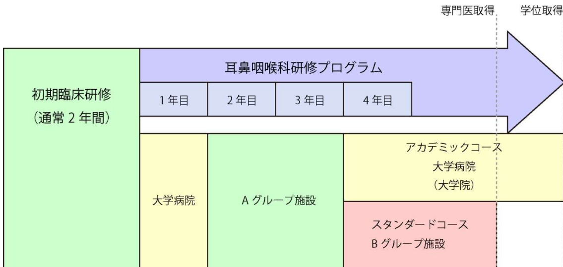
図 1：基本的研修プラン、研修コース例